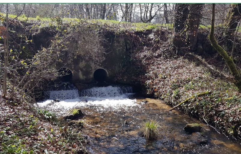
Après travaux : nouveau franchissement sur un nouveau tracé du lit dans le talweg